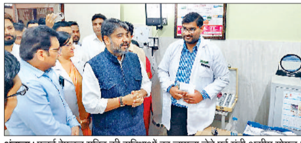
अंबाला। फर्स्ट रेफरल यूनिट की सुविधाओं का जायजा लेते पूर्व मंत्री असीम गोयल।

पूर्व राज्यमंत्री असीम गोयल नयाँला ने अंतरराष्ट्रीय महिला दिवस के अवसर पर सामुदायिक स्वास्थ्य केंद्र चौड़मस्तरपुर में फर्स्ट रेफरल यूनिट (एफआरयू) व नेत्र रोग ओपीडी का रिबन काटकर शुभारंभ किया। इससे पहले उनका यहां पहुंचने पर सिविल सर्जन डॉ. रेनु बेरी व अन्य चिकित्सकों ने पुष्पगुच्छ देकर भव्य अभिनंदन किया। इस अवसर पर डीजी एनएचएम डॉ. वीरेंद्र यादव विशेष