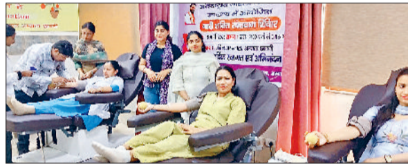
अंबाला। रक्तदान करती स्टाफ कर्मचारी।

अंतरराष्ट्रीय महिला दिवस के अवसर पर स्वास्थ्य विभाग की ओर से नागरिक अस्पताल अंबाला शहर व अम्बाला छावनी में नारी शक्ति रक्तदान शिविर का आयोजन किया गया। शिविर में ब्लड बैंक की टीम ने रक्त एकत्रित करने का काम किया। सिविल सर्जन डॉ. रेनु बेरी ने कहा कि रक्तदान जीवन का सबसे बड़ा दान है। एक स्वस्थ व्यक्ति को रक्तदान अवश्य करना चाहिए। रक्तदान करके हम अमूल्य जिन्दगीयों को बचा सकते हैं। उन्होंने यह भी कहा कि रक्त की पूर्ति केवल मानव शरीर से ही सम्भव है। उन्होंने