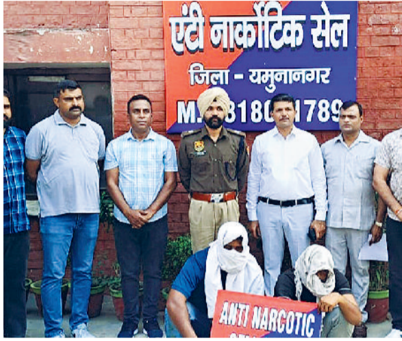
यमुनानगर। एंटी नारकोटिक सेल की टीम द्वारा पकड़े गए आरोपी नशा तस्कर।