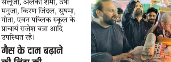
ईरान के हमले के विरोध में अमेरिका व इजराइल का पुतला जलाते हुए नागरिक।