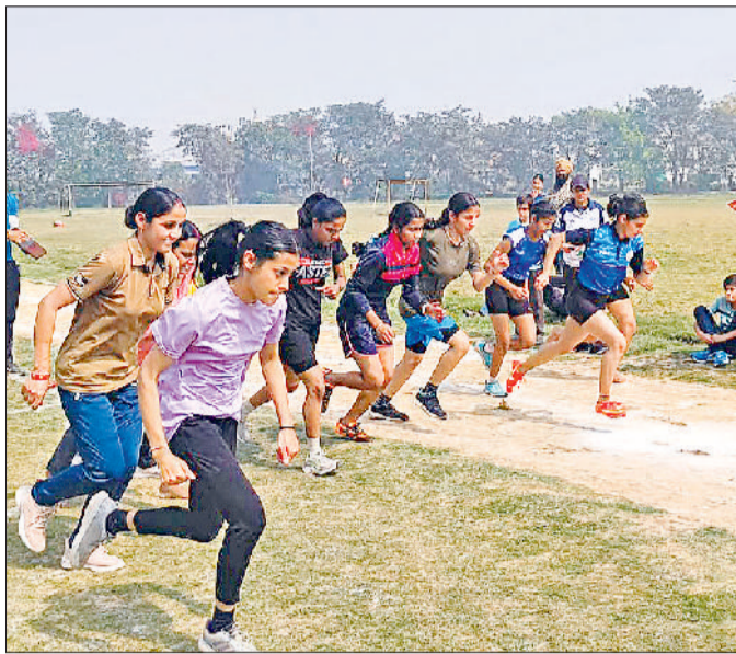
अंबाला। विजेताओं को सम्मानित करते हुए व दौड़ स्पर्धा में हिस्सा लेती युवतियां।